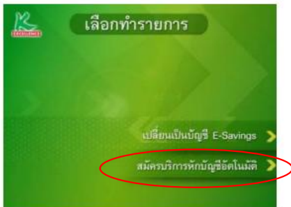
5. เลือก "สมัครบริการหักบัญชีอัตโนมัติ"