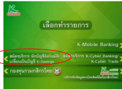
4. เลือก "สมัครบริการ หักบัญชีอัตโนมัติ/เปลี่ยนเป็นบัญชี E-Saving"