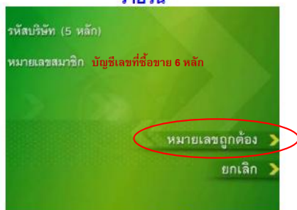
9. ระบุหมายเลขสมาชิกหรือหมายเลขบัญชีของท่านในช่อง "หมายเลขสมาชิก/บัญชี" (Reference)