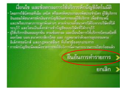
10. กดปุ่ม "ยืนยันการทำรายการ"