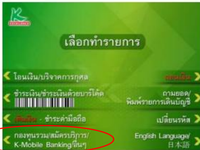
3. เลือก "กองทุนรวมสมัครบริการ/K-Mobile Banking/อื่นๆ"