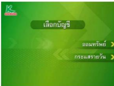
7. เลือกประเภทบัญชีของท่าน เช่น ออมทรัพย์/กระแสรายวัน