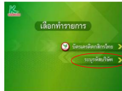
6. เลือก "ระบุรหัสบริษัท"