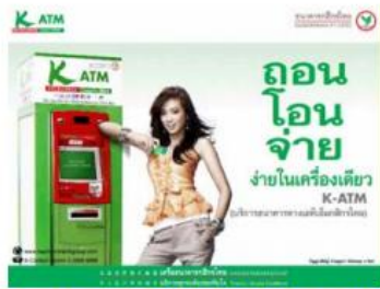
1. สอดบัตร ATM หรือบัตรเครดิต