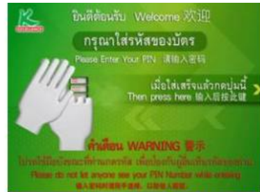
2. กรดรหัสประจำตัว (รหัสผ่าน 4 หลัก)